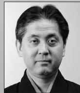
観世 喜正 観世流シテ方 重要無形文化財総合指定