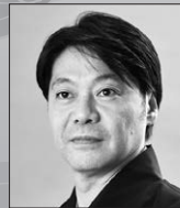
野村 万蔵 和泉流狂言方 重要無形文化財総合指定