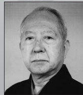
観世 喜之 観世流シテ方 重要無形文化財総合指定