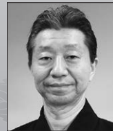
奥川 恒治 観世流シテ方 重要無形文化財総合指定