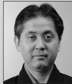
観世喜正 観世流シテ方