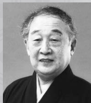
山本 東次郎 (やまもととうじろう) 能楽大蔵流狂言方 山本東次郎家四世当主 重要無形文化財各個指定 (人間国宝)